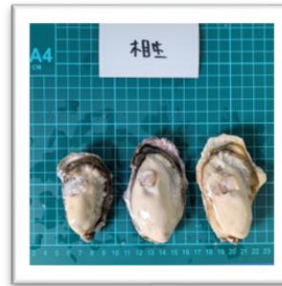
あいおい 兵庫県相生産“相生の恵” ●重さ 65g ●身の重さ 20g ●縦10cm ●横5cm