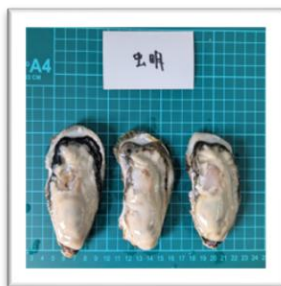
むしあげ 岡山県虫明産 “虫明ヴィーナスオイスター” ●重さ 102g ●身の重さ 26g ●縦11cm ●横5.7cm