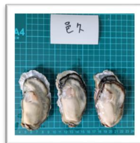
おく 岡山県邑久産 ●重さ 75g ●身の重さ 26g ●縦10cm ●横5.2cm