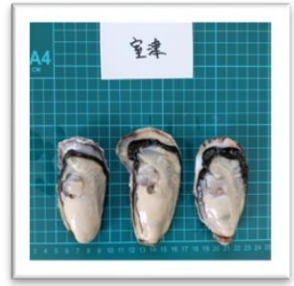
むろつ 兵庫県室津産“がき大将” ●重さ 76g ●身の重さ 23g ●縦10.2cm ●横5.3cm