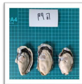
もじ 福岡県門司産 ●重さ 56g ●身の重さ 15g ●縦8.8cm ●横6cm