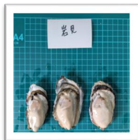
いわみ 兵庫県岩見産 ●重さ 60g ●身の重さ 19g ●縦9.7cm ●横4.5cm