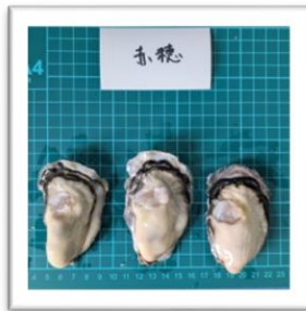
あこう 兵庫県赤穂産 ●重さ 61g ●身の重さ 22g ●縦10cm ●横5.2cm