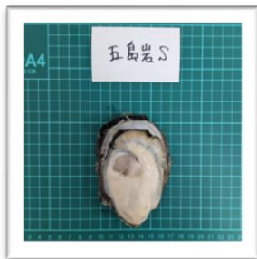
ごとうれっとう 《岩牡蠣》長崎県五島列島産 “椿”Sサイズ ●重さ 171g ●身の重さ 38g ●縦10cm ●横7cm