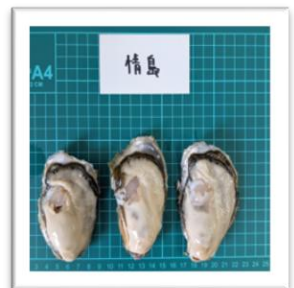
なさけじま なさけのしずく 広島県情島産“情の雫” ●重さ 105g ●身の重さ 27g ●縦11.3cm ●横5.7cm