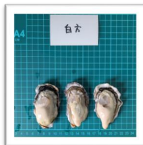
しらかた 香川県白方産 “りょうせん牡蠣” ●重さ 51g ●身の重さ 19g ●縦8.8cm ●横5.3cm