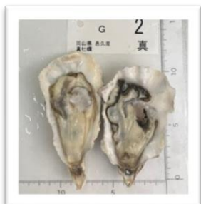
おく 岡山県邑久産 ●重さ 62g ●身の重さ 21g ●縦11cm ●横6cm