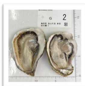
あまちよう 《岩牡蠣》島根県海士町産 “春香” Sサイズ はるか ●重さ 168g ●身の重さ 28g ●縦9.5cm ●横7cm