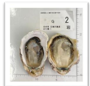
ごとうれっとう 《岩牡蠣》長崎県五島列島産 “椿”Sサイズ つばき ●重さ 167g ●身の重さ 30g ●縦10.5cm ●横8cm