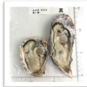
さこし 兵庫県坂越産 ●重さ 66g ●身の重さ 21g ●縦11.7cm ●横6.2cm