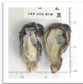
いわみ 兵庫県岩見産 ●重さ 61g ●身の重さ 20g ●縦10.7cm ●横5.3cm