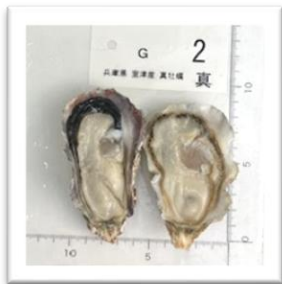
むろつ 兵庫県室津産“がき大将” ●重さ 62g ●身の重さ 21g ●縦10.2cm ●横5.5cm