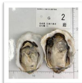
《岩牡蠣》長崎県五島列島産 “椿”SSサイズ つばき ●重さ 117g ●身の重さ 28g ●縦9cm ●横6cm